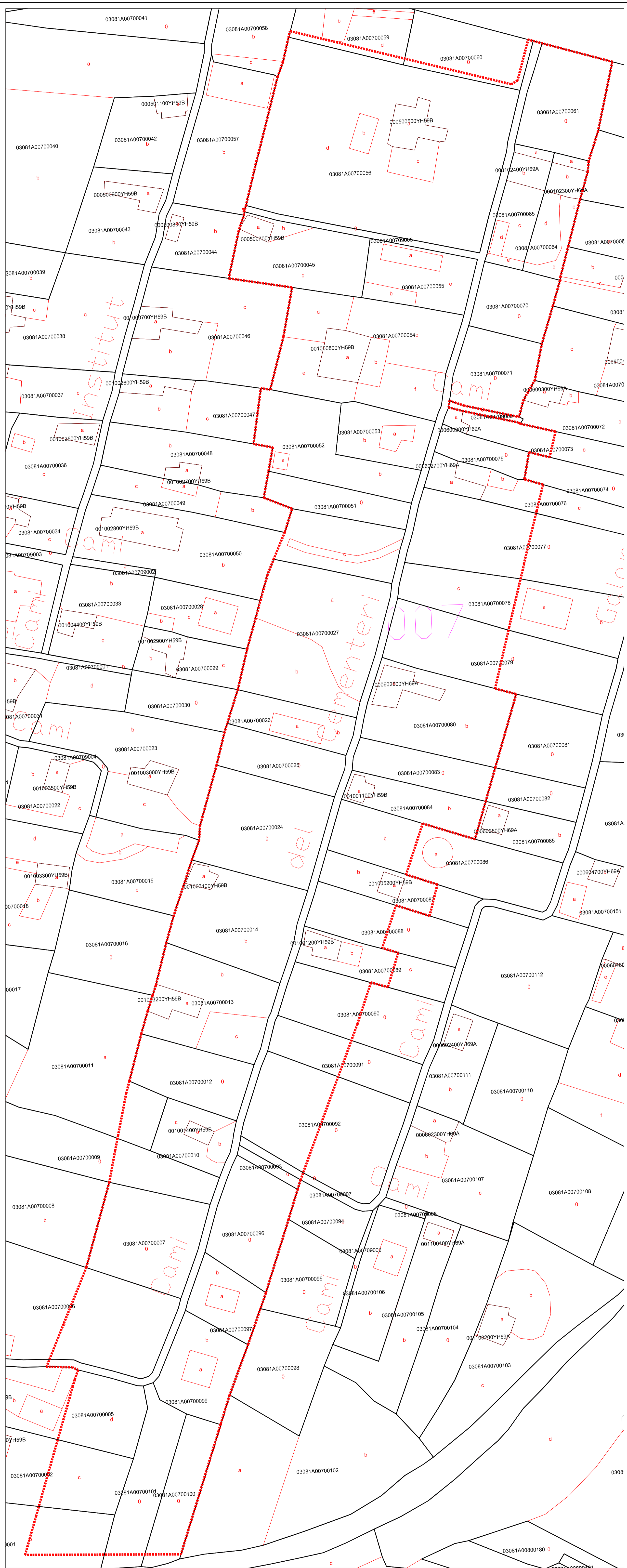
CARTOGRAFIA CATASTRAL ACTUAL E. 1:1.000