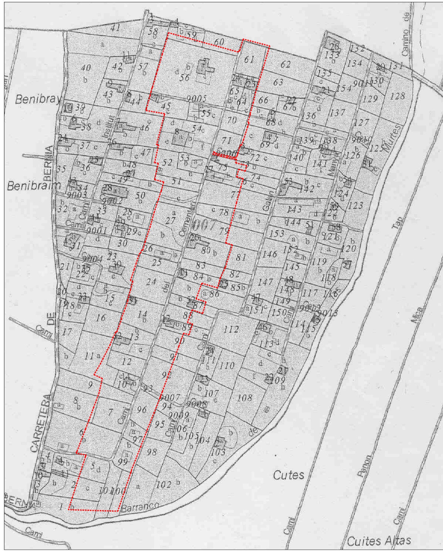
CATASTRO S.I.XX E. 1:4.000